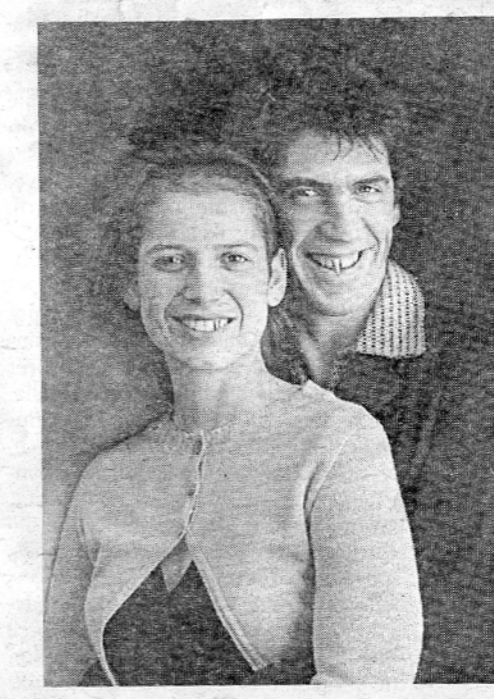
Në foto: "Vil Nor" dhe një autoportret i Effit dhe Amir me dhembë plumbi